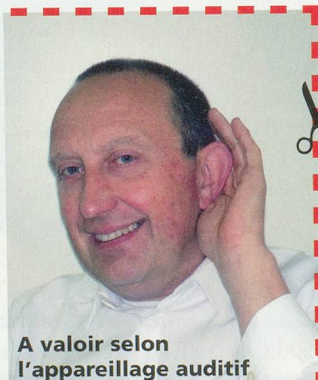
A valoir selon l'appareillage auditif

Si petite, performante et confortable... Portez-là et oubliez-la!