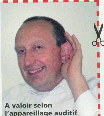
A valoir selon l'appareillage auditif

Si petite, performante et confortable... Portez-là et oubliez-la!