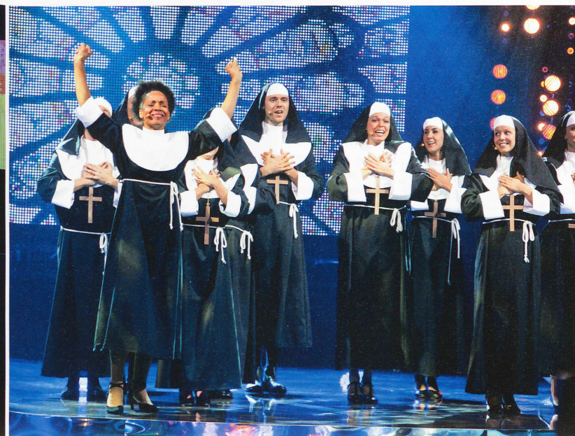
A découvrir bientôt dans l'émission Générations! : la compagnie romande Broadway, dans son interprétation d'un extrait de la comédie musicale Sister Act , inspirée du célèbre film éponyme.

écran, que le tube de ces années-là ait pris un petit coup de vieux ou pas, on se surprend tous à