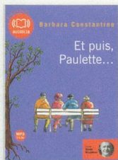
Barbara Constantine, Et puis Paulette , MP3, Audiolib, 30 fr. 80

L a macabre découverte de cinq tombes de petites filles n'augure rien de bon pour l'équipe de criminologues de Goran Gavila. Surtout lorsqu'ils découvrent le bras d'une sixième fillette dans l'une des tombes... Commence alors une course contre la montre pour sauver cette dernière victime. Plein de rebondissements et de fausses pistes, époustoufflant et tenant en haleine, ce roman est un petit bijou dont la fin vous laissera sans voix!