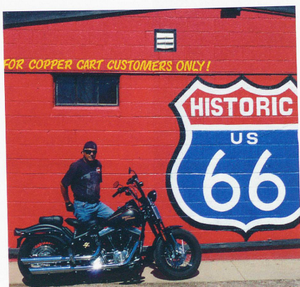
LA LÉGENDAIRE ROUTE 66, DE CHICAGO À SANTA MONICA de Marc Poiré