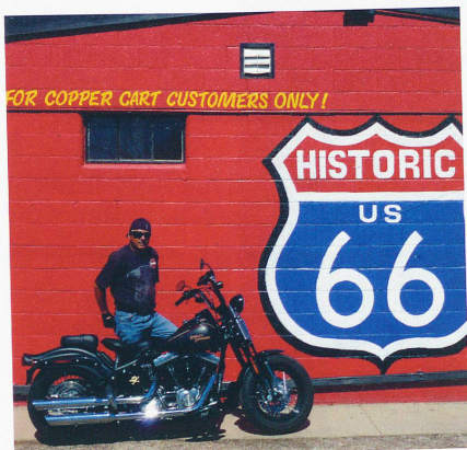
LA LÉGENDAIRE ROUTE 66, DE CHICAGO À SANTA MONICA de Marc Poiriel