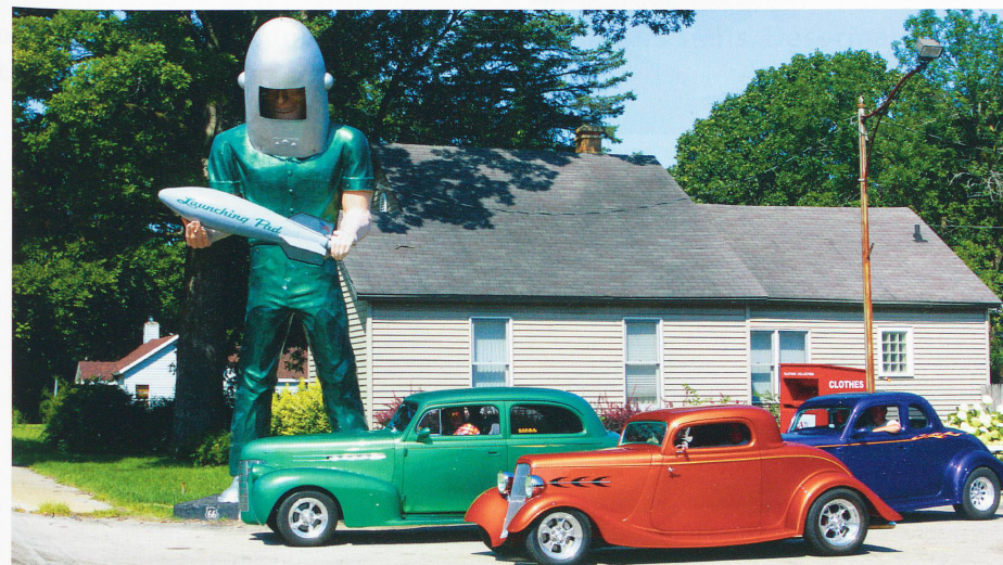
Sur certaines sections de cet interminable ruban reliant Chicago à Los Angeles, des associations se sont battues pour restaurer et maintenir en état les enseignes géantes des restaurants et magasins, ces symboles d'une époque révolue qui font le bonheur aujourd'hui des motards et autres conducteurs nostalgiques.

date de son déclassement au profit de l'autoroute. Mais cette artère mythique reliant Chicago de gens. Redécouvrez-la en ouverture de la saison 2012-2013 d'Exploration du monde.