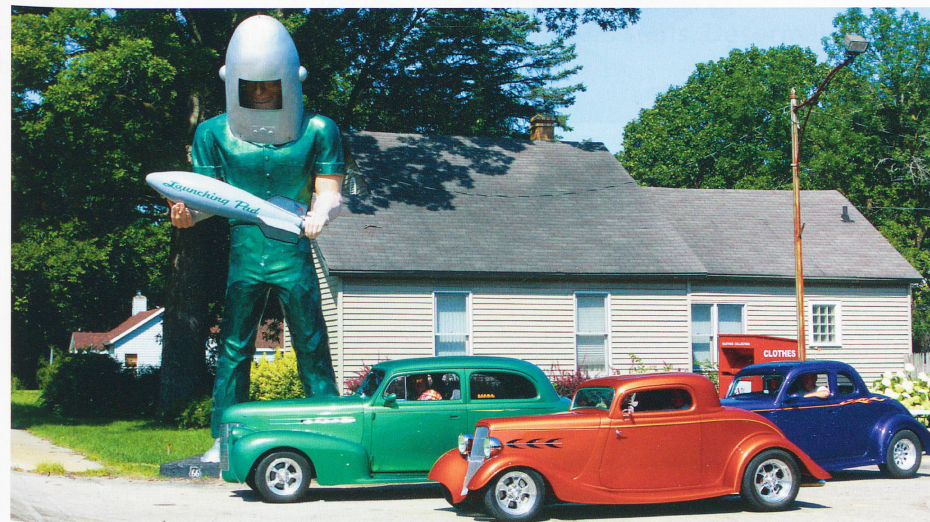
Sur certaines sections de cet interminable ruban reliant Chicago à Los Angeles, des associations se sont battues pour restaurer et maintenir en état les enseignes géantes des restaurants et magasins, ces symboles d'une époque révolue qui font le bonheur aujourd'hui des motards et autres conducteurs nostalgiques.

date de son déclassement au profit de l'autoroute. Mais cette artère mythique reliant Chicago de gens. Redécouvrez-la en ouverture de la saison 2012-2013 d'Exploration du monde.