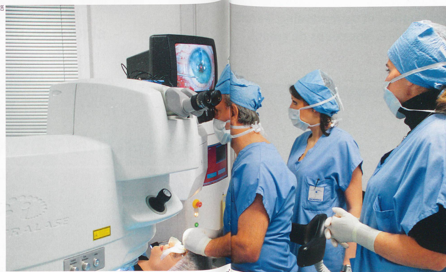
Rapide et sûre, l'opération au laser de la presbytie, appelée Presbylasik, ne dure qu'une trentaine de secondes par œil et peut être réalisée en une seule fois. Après l'opération, la vision de loin se situe entre 60% et 80% selon les patients, mais elle s'améliorera au fil des semaines suivantes, jusqu'à récupération complète.

LES NOUVEAUTÉS (OU PRESQUE): la pose d'implants multifocaux s'adresse aux individus âgés de plus de 55 ans ayant une presbytie plus évoluée. Actuellement, les implants intraoculaires multifocaux