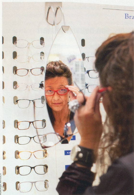
Au-delà de l'aspect esthétique, la monture doit aussi correspondre au type de correction.

Impossible d'échapper à cette malédiction de l'âge. Mais on peut y faire face avec des lunettes,