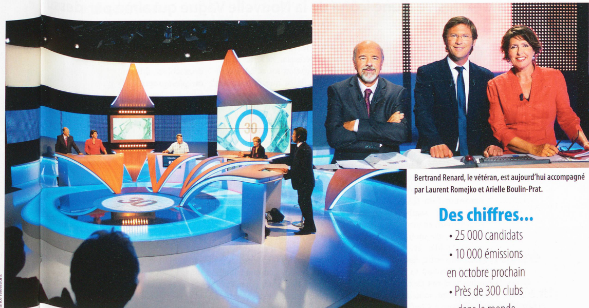
Créée par Armand Jammot, Des chiffres et des lettres est la plus ancienne émission quotidienne diffusée par la télévision française.

A voir sur France 3, du lundi au vendredi à 16 h 40