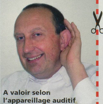
A valoir selon l'appareillage auditif

Si petite, performante et confortable... Portez-là et oubliez-la!