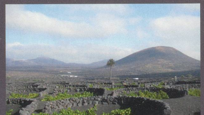
Randonnées guidées par Nadine Girardot