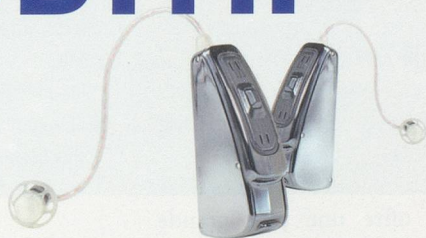
PHONAK AUDEO S SMART IX CERAMIC