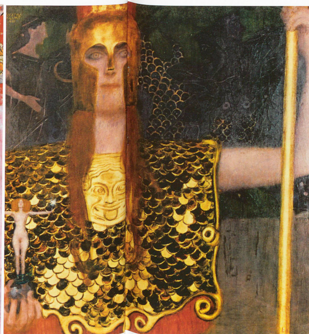
Pallas Athéna, 1898