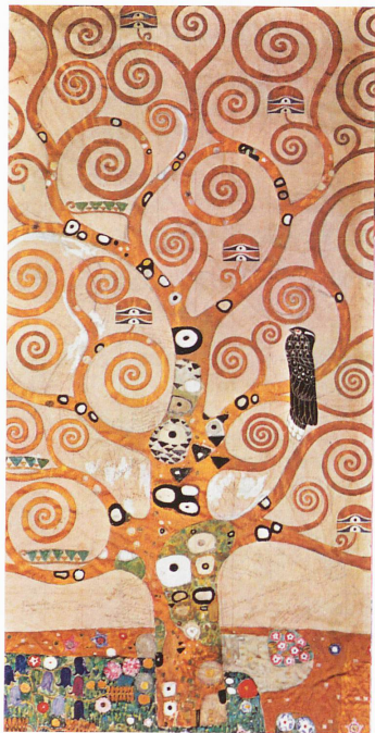
L'Arbre de Vie (détail), 1905-1909