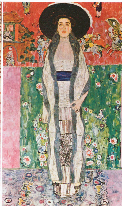
Portrait d'Adèle Bloch-Bauer II, 1912