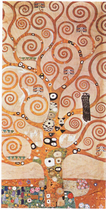
L'Arbre de Vie (détail), 1905-1909