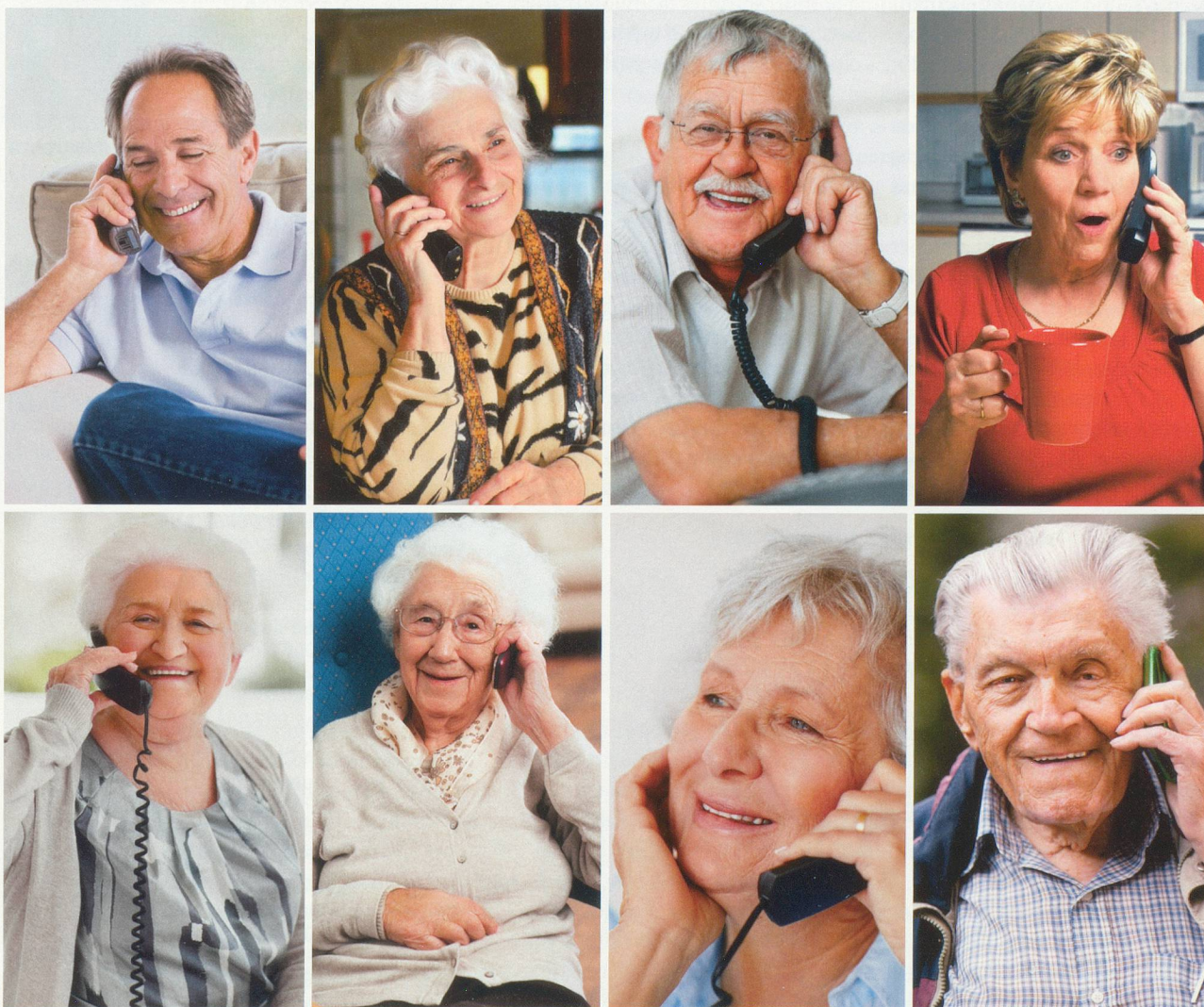
Monkey Business Images, Mikhail Tchkhedze, Yuri Arcurs, Bryan Sikora, Tyler Olson

Ce concept développé par Pro Senectute consiste à appeler régulièrement un autre aîné. En faisant partie ainsi d'un petit réseau de quelques personnes, cette ligne de solidarité permet d'éviter l'isolement social.