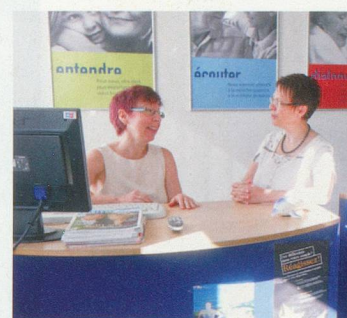
Notre équipe de 15 Audioprothésistes diplômés vous assiste sur toutes les questions concernant votre audition.

Nos consultations auditives professionnelles commencent par un test auditif gratuit et un entretien sans engagement. Le client est le centre de nos préoccupations. Nos locaux clairs et leurs aménagements modernes ne laissent rien à désirer. Nos 15 points de vente se situent toujours en plein cœur de la ville dans tous les cantons romands, accessibles très facilement en voiture, à pied ou par les transports en commun. Votre visite sera toujours la bienvenue.