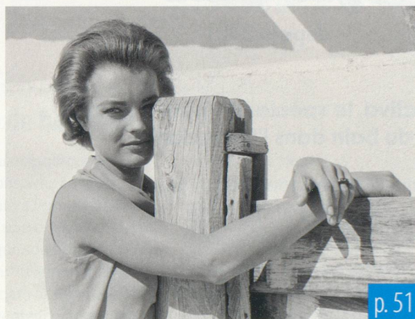
Bett Stills Gamma-Rapho