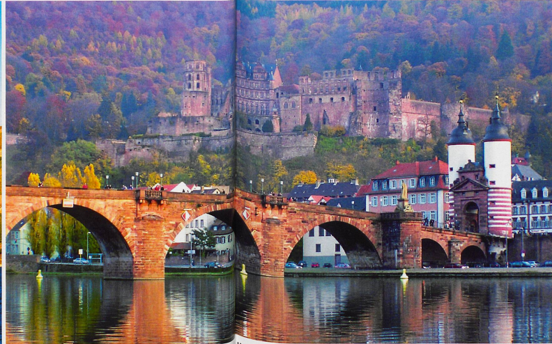
Impossible de ne pas la prendre en photo. La forteresse Heidelberg (1398-1410) est devenue au fil des siècles une majestueuse demeure surplombant la rivière Neckar.

sons anciennes, ses deux églises gothiques, le château de Schönburg, parfaitement restauré après avoir été détruit par les Français – comme beaucoup de ses voisins – en 1689. Son impressionnante façade rougeâtre fait son effet.