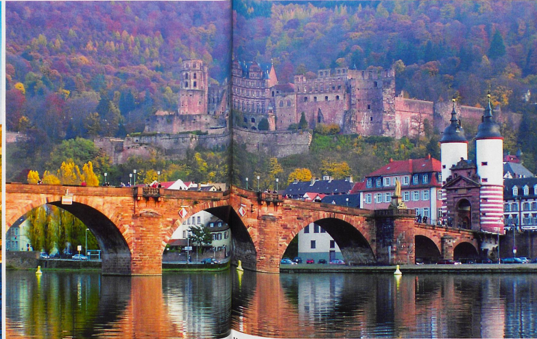
Impossible de ne pas la prendre en photo. La forteresse Heidelberg (1398-1410) est devenue au fil des siècles une majestueuse demeure surplombant la rivière Neckar.