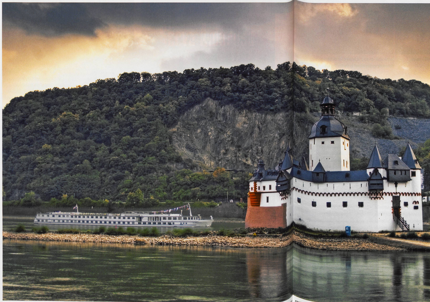
Le château de Pfalzgrafenstein a été érigé de 1326 à 1327 par le roi Louis IV de Bavière. Il avait initialement une fonction de station de péage. Une chaîne à travers le fleuve contraignait les navires à se présenter, et les commerçants récalcitrants

Des châteaux forts, des forteresses, des villages médiévaux... Entre Bingen et Coblenze, sur 65 kilomètres, les vestiges du passé mêlent histoire et légendes locales. Un décor propice aux chevauchées fantastiques et imaginaires.