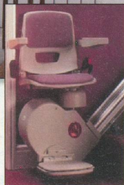
Lifts à siège