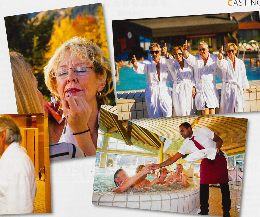
Changement de tenue et raccord maquillage: les stars du jour se sont montrées très professionnelles.

Tirée à quatre épingles, comme les autres candidats d'ailleurs, la Pranginoise considère que la beauté est très importante. «Il faut se soigner, suivre une hygiène de vie à un certain âge, afin de conserver une apparence plaisante. Ce n'est pas parce que l'on est âgé que l'on doit se laisser aller!»