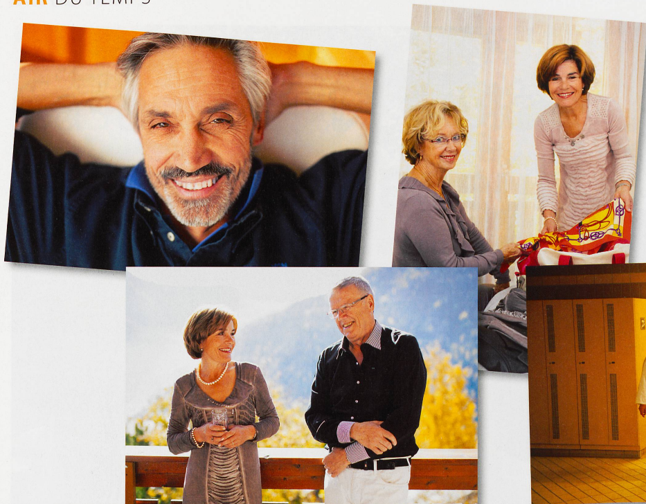
Entre deux séances de photos, les gagnants ont profité de se détendre, sous le soleil valaisan.