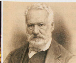
Victor Hugo dialoguait avec les morts grâce à une table tournante.