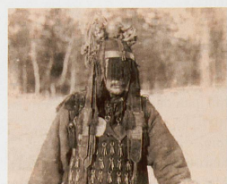
En Sibérie, le chaman échangeait avec l'au-delà lors de transes.

Ce n'était pas le but. Maintenant, c'est vrai que je ne suis pas une journaliste, je suis cinéaste. Et dans tous mes films, j'ai toujours travaillé par immersion. Et puis, je le reconnais: je suis persuadée qu'il y a des choses qui échappent à notre connaissance et à la science, l'hypothèse la plus vraisemblable est qu'il existe une vie après la mort. J.-M.R.