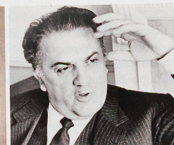
Le cinéaste italien Fellini consultait très souvent des médiums.