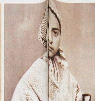
Bernadette Soubirou, elle vu la Vierge ou une autre?