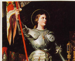
Jeanne d'Arc est classée par certains parmi les médiums clairvoyants.