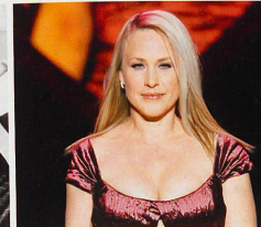
L'actrice Patricia Arquette interprète la plus célèbre des médiums à la TV.