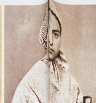
Bernadette Soubirous elle-même vu la Vierge ou une ordinaire?