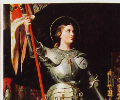
Jeanne d'Arc est classée par certains parmi les médiums clairvoyants. Dominique Ingres