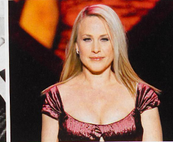
L'actrice Patricia Arquette interprète la plus célèbre des médiums à la TV.