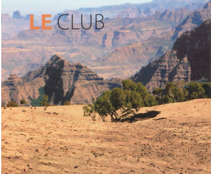
Shutterstock Andrushko, Traveller