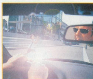
Sans lunettes de soleil polarisantes