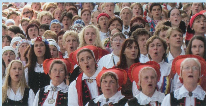
En 1989, les Pays Baltes ont réclamé leur indépendance en formant une chaîne humaine sur plus de 650 km.