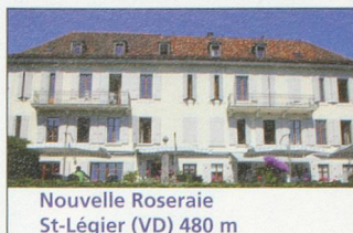
Nouvelle Roseraie St-Légier (VD) 480 m

VOYAGES / VACANCES, Suisse/étranger. Organisation et conseils personnalisés. Garantie du voyage. Intertra- vel, tél. 027 323 49 40, www.intertravel.org , intertravel@netplus.ch