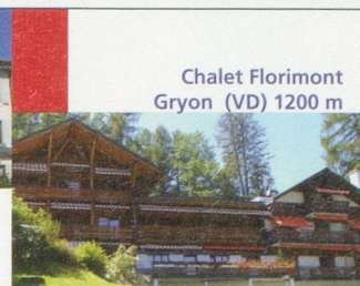
Chalet Florimont Gryon (VD) 1200 m