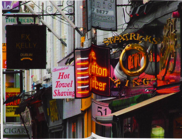
La rue piétonne de Grafton est l'une des plus importantes artères commerçantes de Dublin.