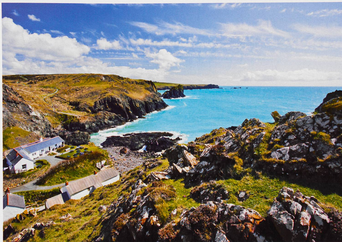
Considérée comme l'un des plus beaux coins de la côte des Cornouailles, la crique de Kynance Cove devenue populaire au début de l'époque victorienne.