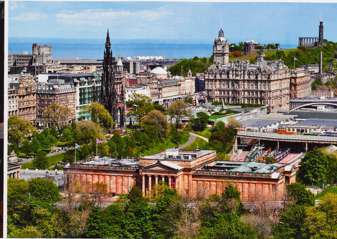
Edimbourg offre le visage harmonieux d'une vieille ville, dominée par une forteresse médiévale, et d'une ville nouvelle néoclassique.