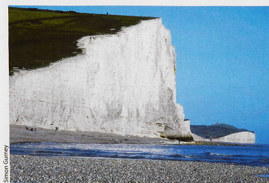
Les falaises de craie, près d'Eastbourne dans le sud de l'Angleterre, méritent le détour.