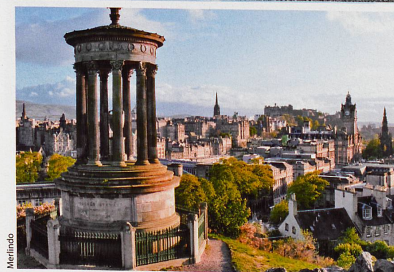
Capitale de l'Ecosse depuis 1437, Edimbourg se dresse sur la côte Est.