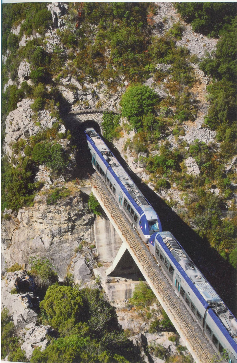
Sur la ligne du col de Tende, le «train des merveilles» emprunte des ouvrages spectaculaires qui raviront les passagers.