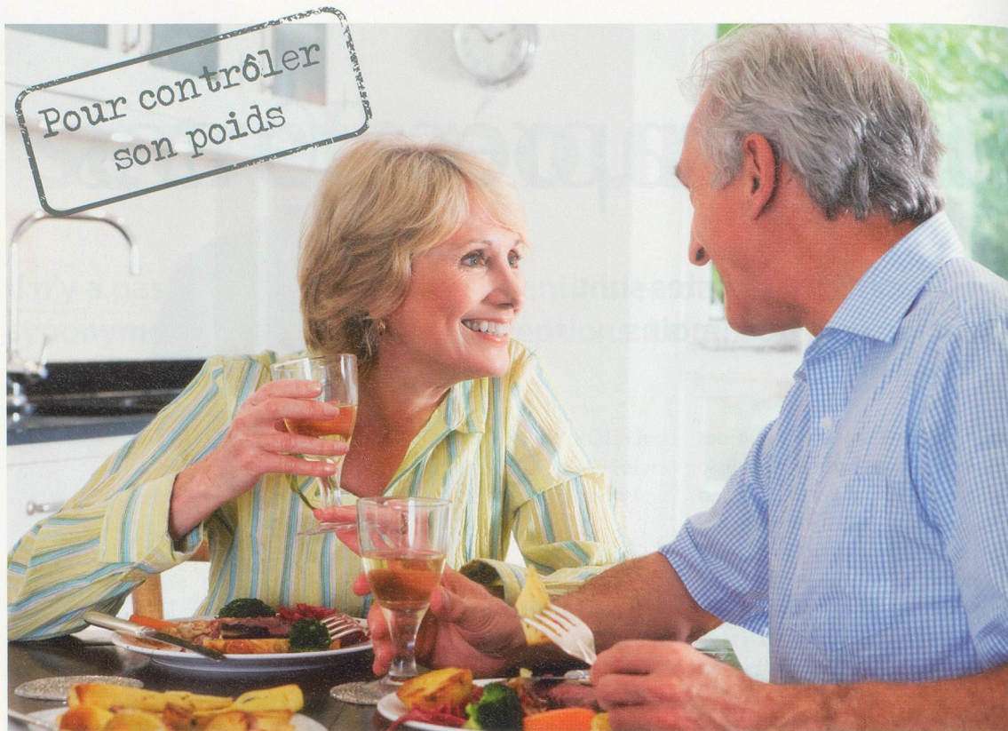
Etre à l'écoute de son corps, du sentiment de satiété contribue à garder la ligne. Inutile de finir son assiette!

tionnement de notre corps, mais de respecter les proportions. A savoir consommer peu de la strate du sommet (sucres rapides), d'être attentif à la quantité et à la qualité des matières grasses utilisées, de veiller à absorber suffisamment d'aliments contenant des protéines pour préserver notre masse musculaire, de fruits et de légumes (fibres vitamines), sans oublier les féculents, indispensables en tant que carburant, et l'hydratation qui constitue le socle de la pyramide. «C'est d'autant plus important qu'avec l'âge, les gens perdent souvent la sensation de soif. Or, notre corps est quand même constitué principalement d'eau», rappelle-t-elle.