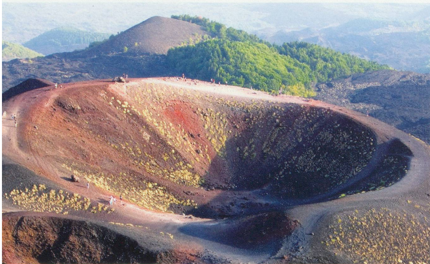
Culminant à 3300 mètres d'altitude, l'Etna est l'un des volcans les plus actifs au monde avec près de 100 éruptions au XX e siècle.