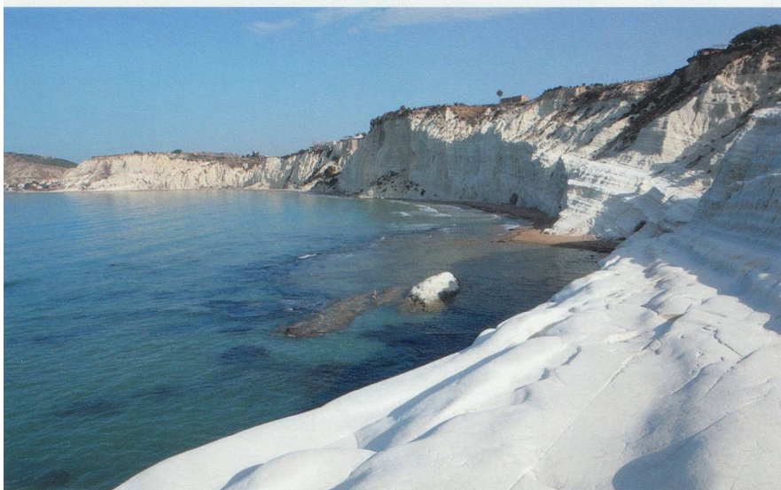
Scala dei Turchi, une plage éblouissante au propre comme au figuré avec son sable blanc.