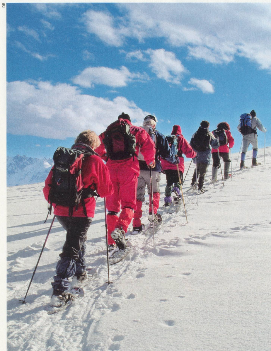
Cette discipline vous emmène dans des paysages grandioses sans avoir nécessité un apprentissage technique difficile. La raquette est en effet basée sur le mouvement naturel qu'est la marche.

En chaussant les raquettes, nos aînés nous prouvent qu'ils suivent les tendances. Certainement plus