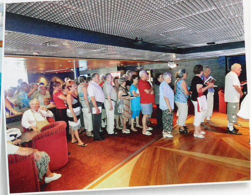
Une file de 400 fans, tous livre en main, et trois heures de signatures.