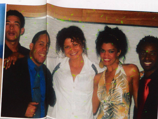
Alegria Tropical, le groupe dominicain trois étoiles qui jouait à bord.