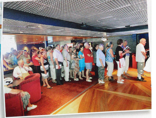
Une file de 400 fans, tous livre en main, et trois heures de signatures.