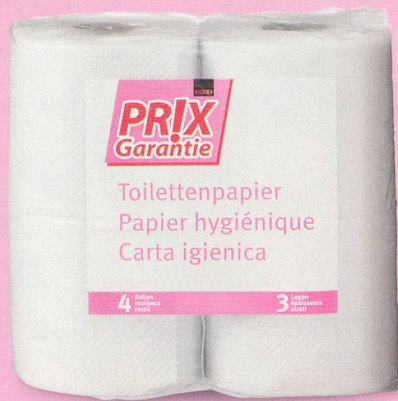
Papier hygiénique Coop Prix Garantie 4 rouleaux fr. 1.25