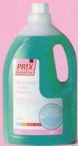
Lessive Coop Prix Garantie 2 litres fr. 4.30