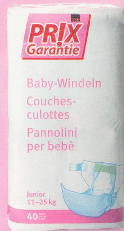
Couches-culottes Junior Coop Prix Garantie 40 pièces fr. 9.55