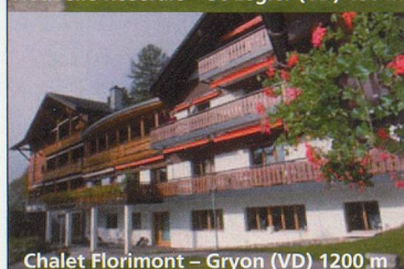
Chalet Florimont - Gryon (VD) 1200 m