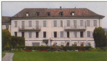
Nouvelle Roseraie - St-Légier (VD) 480 m