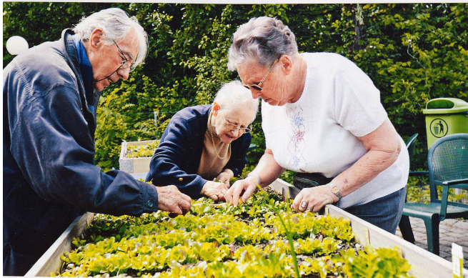
Les pensionnaires sont très méticuleux dans leur travail. Planter, désherber et récolter le fruit de leur labeur ensemble procure par ailleurs un sentiment