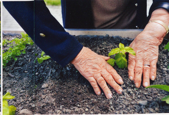
de satisfaction intense. D'autant qu'ils n'ont pas à courber l'échine.