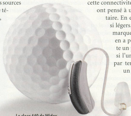
Le clear 440 de Widex peut se connecter aux appareils de la maison.

«Le Widex Clear 440 a aussi développé cette connectivité "interaurale". Mais ils ont pensé à une astuce supplémentaire. En effet, les appareils sont si légers, si petits, qu'on ne remarque pas forcément qu'on en a perdu un lors d'un geste un peu brusque. Du coup, si l'un des écouteurs tombe par terre, le deuxième émet un signal. Une voix, similaire à celle d'un GPS, avertit l'utilisateur qu'il a perdu l'un de ses écouteurs. Elle se déclenche à partir d'une certaine distance.»