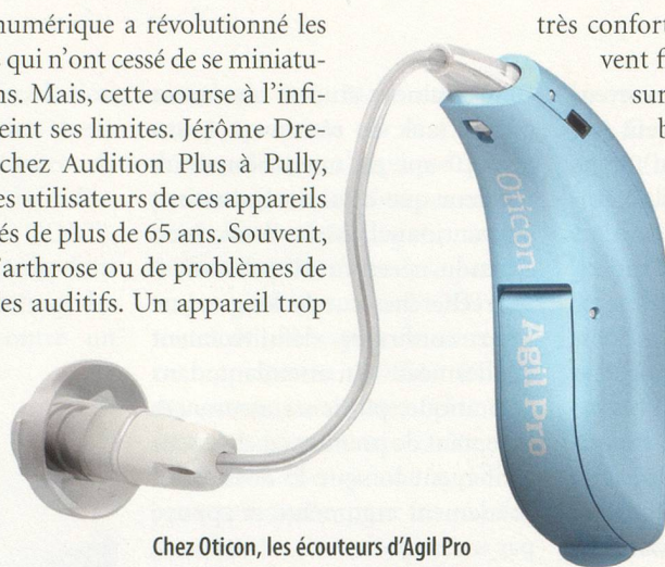
Chez Oticon, les écouteurs d'Agil Pro communiquent entre eux, de manière à gérer au mieux les fréquences sonores.

«Le traitement du son des appareils auditifs est désormais