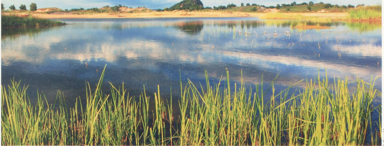
Magnifiquement préservée dans une bonne partie des pays Baltes, la nature offre des tableaux d'une beauté saisissante, comme ce marécage en Lituanie.

deux plus grandes sont Saaremaa et Hiiumaa. On y trouve des espaces à profusion et une tranquillité totale, sans doute due au fait qu'elles ne comportent aucune industrie, la seule activité économique de taille étant l'agriculture.