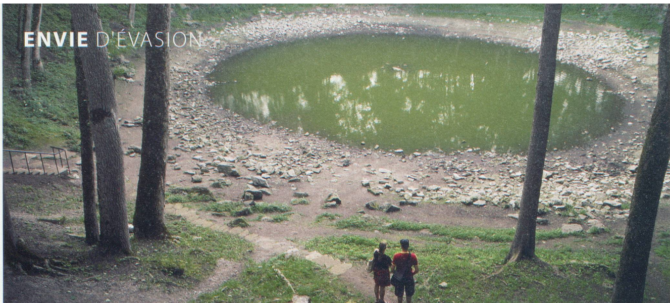
Aussi rare qu'étonnant, ce lac, sur l'île de Saaremaa, a été créé par la chute d'un météore de 1000 tonnes.

L ituanie. Estonie. Lettonie. Pour beaucoup d'Occidentaux, les pays Baltes conservent toujours un parfum de mystère. Quoi de plus normal: sous le joug de l'URSS, ces destinations ne figuraient pas jamais aux frontons des agences de tourisme. Depuis 1991, le voile s'est levé progressivement et les beautés de Vilnius, Riga et Tallinn, les trois capitales, se laissent enfin admirer dans leurs plus beaux atours architecturaux. Particulièrement préservés, les paysages, la faune et les plages sont devenus des atouts de premier ordre pour relancer l'économie.