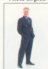
10 x 15 cm