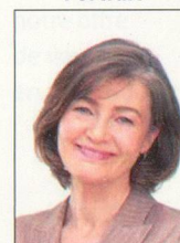
10 x 15 cm