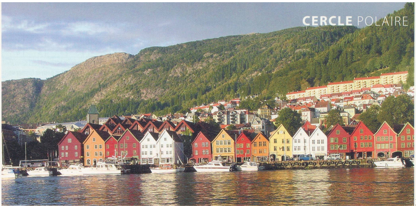
C'est ici, dans la charmante ville de Bergen, que débutent ou s'achèvent les croisières de la compagnie Hurtigruten.

14 degrés au cœur de l'été. On peut se déplacer en voiture à travers les Lofoten, mais les autochtones préfèrent les bateaux pour accéder aux habitations disséminées le long du littoral.