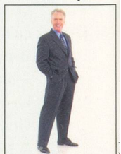
10 x 15 cm