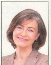
10 x 15 cm