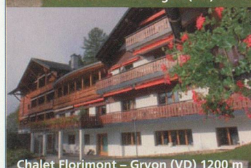
Chalet Florimont - Gryon (VD) 1200 m