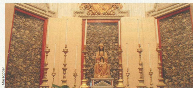
Les ossements de 800 personnes reposent pêle-mêle dans la cathédrale.

En Italie, chaque petite église vaut le détour. Attention toutefois, les horaires dans les Pouilles sont très très aléatoires. On pourrait croire qu'ils correspondent aux heures de sieste, mais cela doit être beaucoup plus compliqué que cela. Les raisons doivent échapper aux touristes. Ce qui est sûr, c'est que ces monuments peuvent rester fermés 23 heures sur 24. Et ne vous fiez pas au panneau qui indique que les portes seront à nouveau ouvertes vers 16 heures, vous pourriez attendre jusqu'au lendemain. Reste qu'il vaut parfois la peine d'insister, quitte à revenir notamment quand il s'agit d'une cathédrale comme celle d'Otrante. On admirera bien sûr son ampleur et sa mosaïque même si les spécialistes n'accordent à l'édifice qu'une note finalement moyenne. Par contre, on reste bouche bée devant les sept grandes armoires situées dans une petite salle de la maison de Dieu. Oui, on peut dire qu'on est soufflé par le contenu à la fois lugubre et étonnant qui s'y trouve. Ce n'est pas tous les jours qu'on se retrouve face aux ossements entassés et