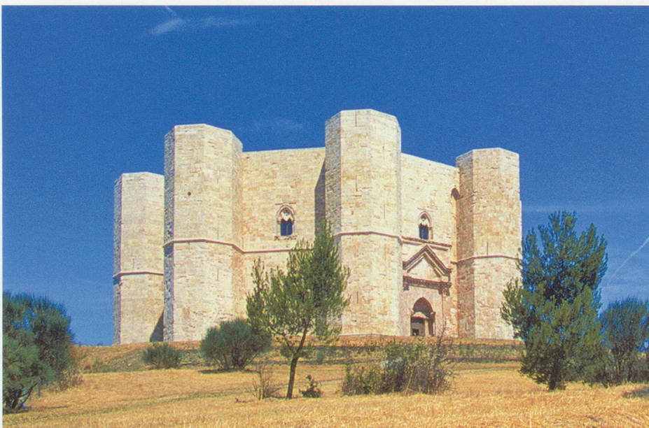
Aujourd'hui encore, les spécialistes s'interrogent sur la fonction du Castel del Monte. Pas de logements et de défenses, le château avait sans doute un rôle lié à l'astrologie.