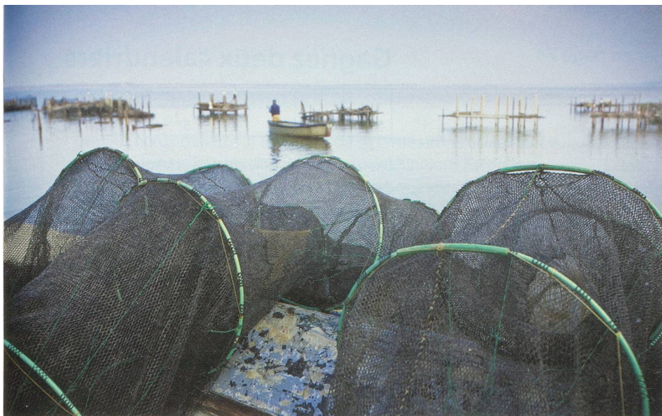
La pêche est une des activités importantes des Pouilles. La cuisine traditionnelle dans la région laisse d'ailleurs peu de place à la viande.