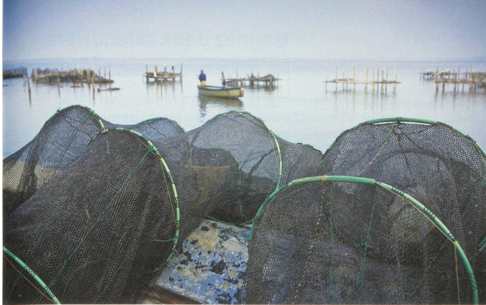
La pêche est une des activités importantes des Pouilles. La cuisine traditionnelle dans la région laisse d'ailleurs peu de place à la viande.