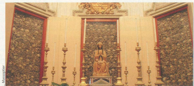
Les ossements de 800 personnes reposent pêle-mêle dans la cathédrale.

En Italie, chaque petite église vaut le détour. Attention toutefois, les horaires dans les Pouilles sont très très aléatoires. On pourrait croire qu'ils correspondent aux heures de sieste, mais cela doit être beaucoup plus compliqué que cela. Les raisons doivent échapper aux touristes. Ce qui est sûr, c'est que ces monuments peuvent rester fermés 23 heures sur 24. Et ne vous fiez pas au panneau qui indique que les portes seront à nouveau ouvertes vers 16 heures, vous pourriez attendre jusqu'au lendemain. Reste qu'il vaut parfois la peine d'insister, quitte à revenir notamment quand il s'agit d'une cathédrale comme celle d'Otrante. On admirera bien sûr son ampleur et sa mosaïque même si les spécialistes n'accordent à l'édifice qu'une note finalement moyenne. Par contre, on reste bouche bée devant les sept grandes armoires situées dans une petite salle de la maison de Dieu. Oui, on peut dire qu'on est soufflé par le contenu à la fois lugubre et étonnant qui s'y trouve. Ce n'est pas tous les jours qu'on se retrouve face aux ossements entassés et