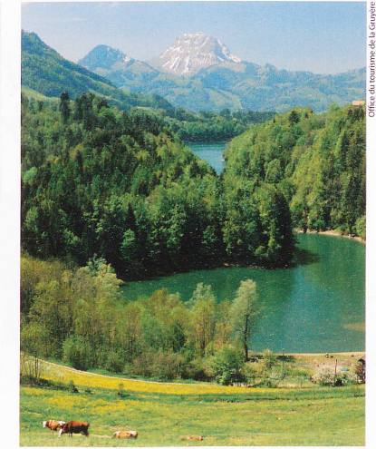
Office du tourisme de la Gruyère