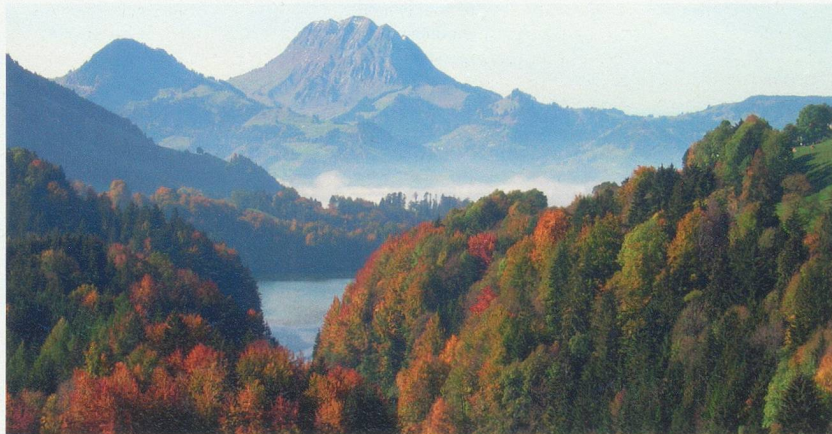
Office du tourisme de la Gruyère

Distance: 10 km Dénivelé: 244 m Altitude max.: 885 m. Durée: 2 h 50