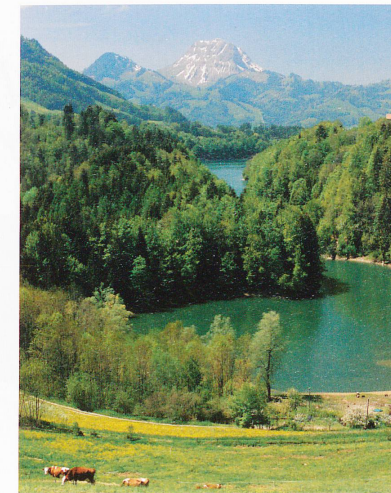
Office du tourisme de la Gruyère