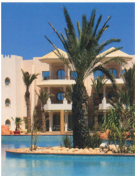
Soleil, cascades, piscines, mer que demander de plus?

En quinze ans, la Tunisie s'est dotée d'une quarantaine de centres thalasso intégrés dans de luxueux hôtels. A seulement deux heures d'avion de la Suisse.