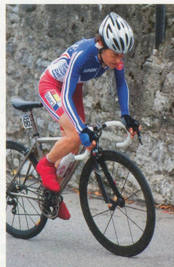
Jeannie Longo a terminé 4 e des derniers Mondiaux de Mendrizio en 2009.