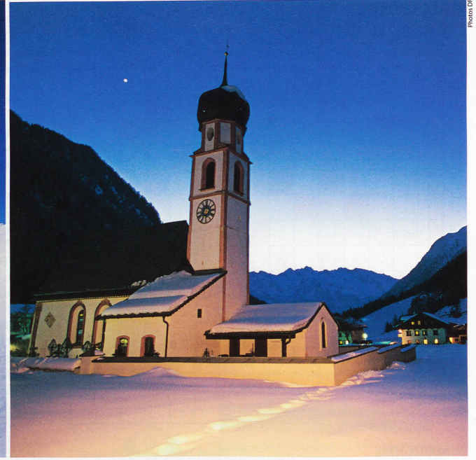
Impossible de s'ennuyer dans cette région d'Autriche. Au contraire, les voyageurs ne savent plus où donner de la tête entre des moments de détente nocturne dans une piscine ou des excursions à peaux de phoque. Au passage, ils peuvent également admirer des monuments comme cette église posée sur un manteau de neige.

S ur la route qui mène à Innsbruck, plusieurs stations de ski affichent complet dès la chute des premiers flocons. Les touristes viennent d'Allemagne, de Suisse orientale et d'Autriche, mais également du nord de l'Italie et de Suisse romande. Qu'est-ce qui motive Neuchâtelois, Fribourgeois et Vaudois à parcourir des centaines de kilomètres pour