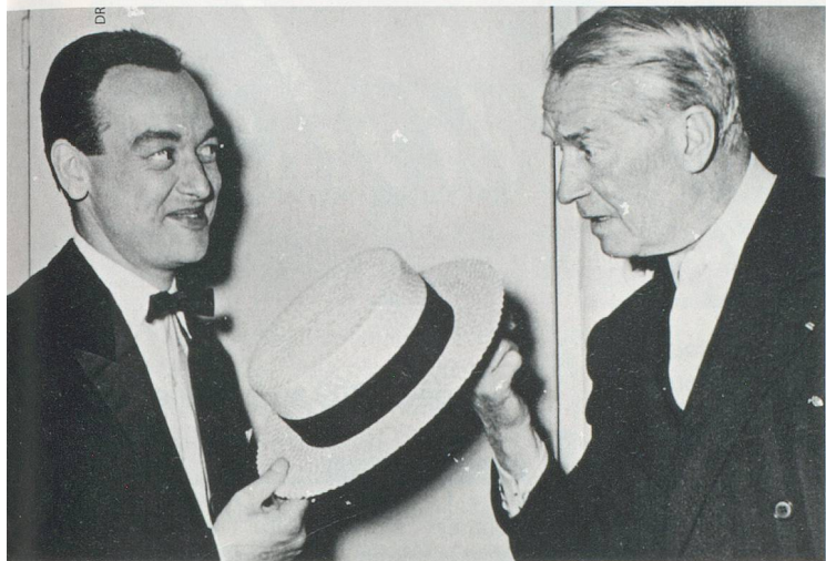
Chapeau bas, la rencontre avec un très grand monsieur de la scène en 1957, au Casino Théâtre de Genève: Maurice Chevalier en personne.

genevois souffle ses 90 bougies en brûlant de spectacle.