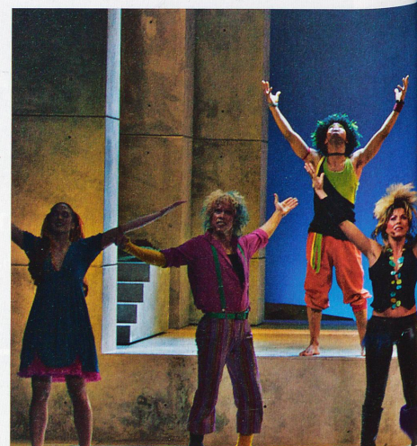
L'amour et la joie de vivre. En dehors des clichés sur les paradis artificiels, les

Pour mettre en valeur leur message, les auteurs d' Hair utilisent de la pop et du rock, avec quelques morceaux qui resteront dans l'histoire: Let The Sun Shine In et Aquarius . En outre, la mise en scène de la pièce se veut provocante avec des moments de nudité intégrale et des simulacres de copulation.