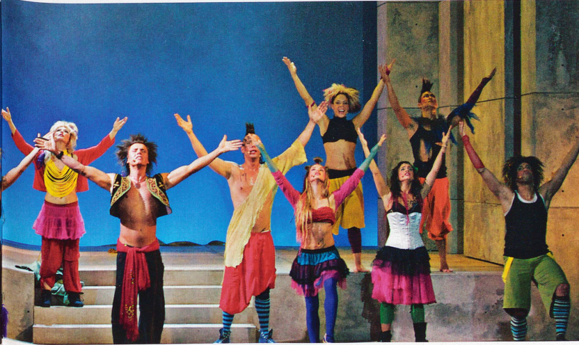
hippies véhiculaient une philosophie empreinte d'une saine logique. A méditer?