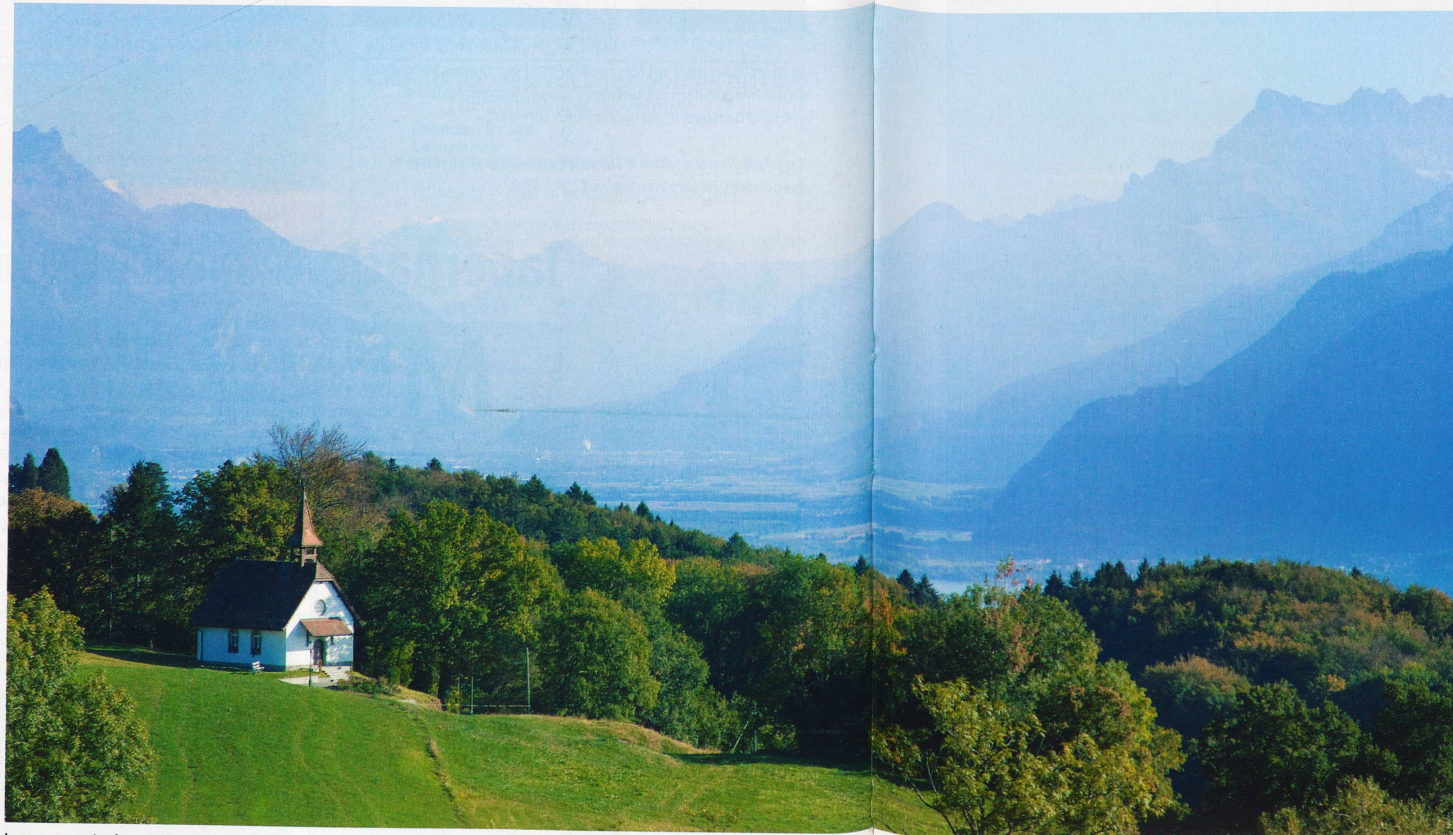
La vue est tout simplement magnifique depuis le Mont-Pèlerin. Alpes, forêts et lac s'entremêlent dans un paysage fantastique.

Tout effort mérite récompense, diront les gourmands. Alors suivez-nous au Mont-Pèlerin. Les promenades sont absolument superbes et le final ne l'est pas moins du côté de Palézieux avec un passage obligé dans la chocolaterie de Mélinda Rost.