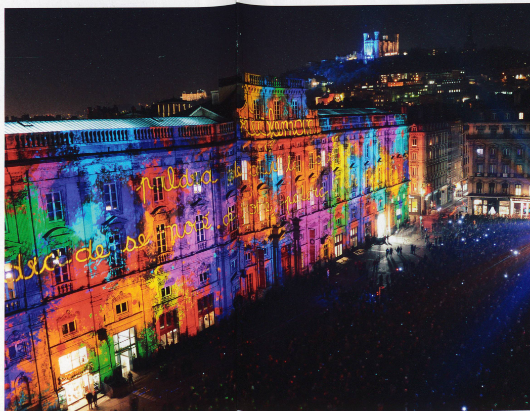
Chaque année, les concepteurs de la fête rivalisent d'imagination et de moyens

vières sur la colline qui domine la ville – il n'y avait pas encore la basilique – d'une statue gigantesque de la Vierge, dorée à la feuille. Un sculpteur local est chargé de la réalisation. La date de l'inauguration est fixée au 8 septembre 1852, jour de la Nativité de la Marie. Las, une crue de la Saône inonde les ateliers et la célébration doit être repoussée. Une nouvelle date est arrêtée: ce sera le 8 décembre, fête de l'Immaculée Conception. Messes, bénédiction de la statue,