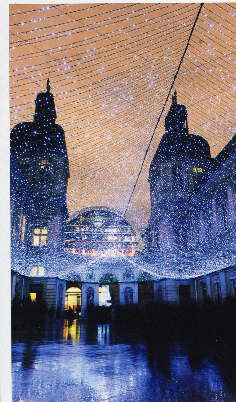
Pour embellir la cité. Le succès populaire est au rendez-vous: des millions de visiteurs se pressent au cœur de la nuit. Pour quatre représentations uniques.

illuminations de la ville et feux d'artifices, tout est prêt pour que l'événement soit grandiose. Hélas! un violent orage vient contrecarrer le programme: toutes les réjouissances sont annulées.