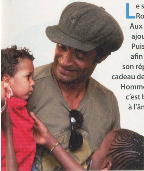
Séverine Rouiller / clind'oeil

L e seul chanteur français à avoir remporté Roland-Garros nous étonnera toujours. Aux rythmes africains et au reggae, il a ajouté les mélodies des Indiens du Chili. Puis il a marié guitares d'ici et de là-bas, afin d'insuffler une touche nouvelle à son répertoire. Fidèle à ses habitudes, il fait cadeau de son nouveau spectacle à Terre des Hommes. Ça s'appelle Charango , ça balance, c'est beau, c'est généreux et ça fait du bien à l'âme.