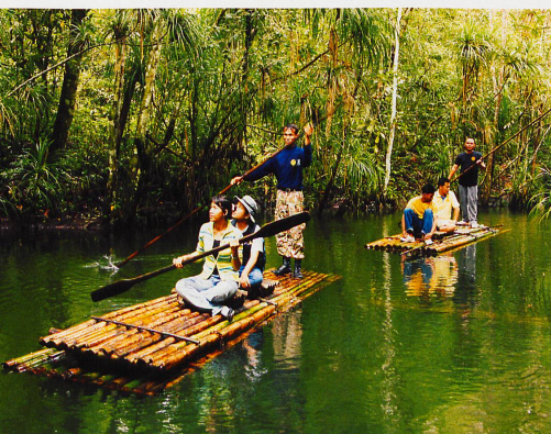
Office du tourisme de Thaïlande