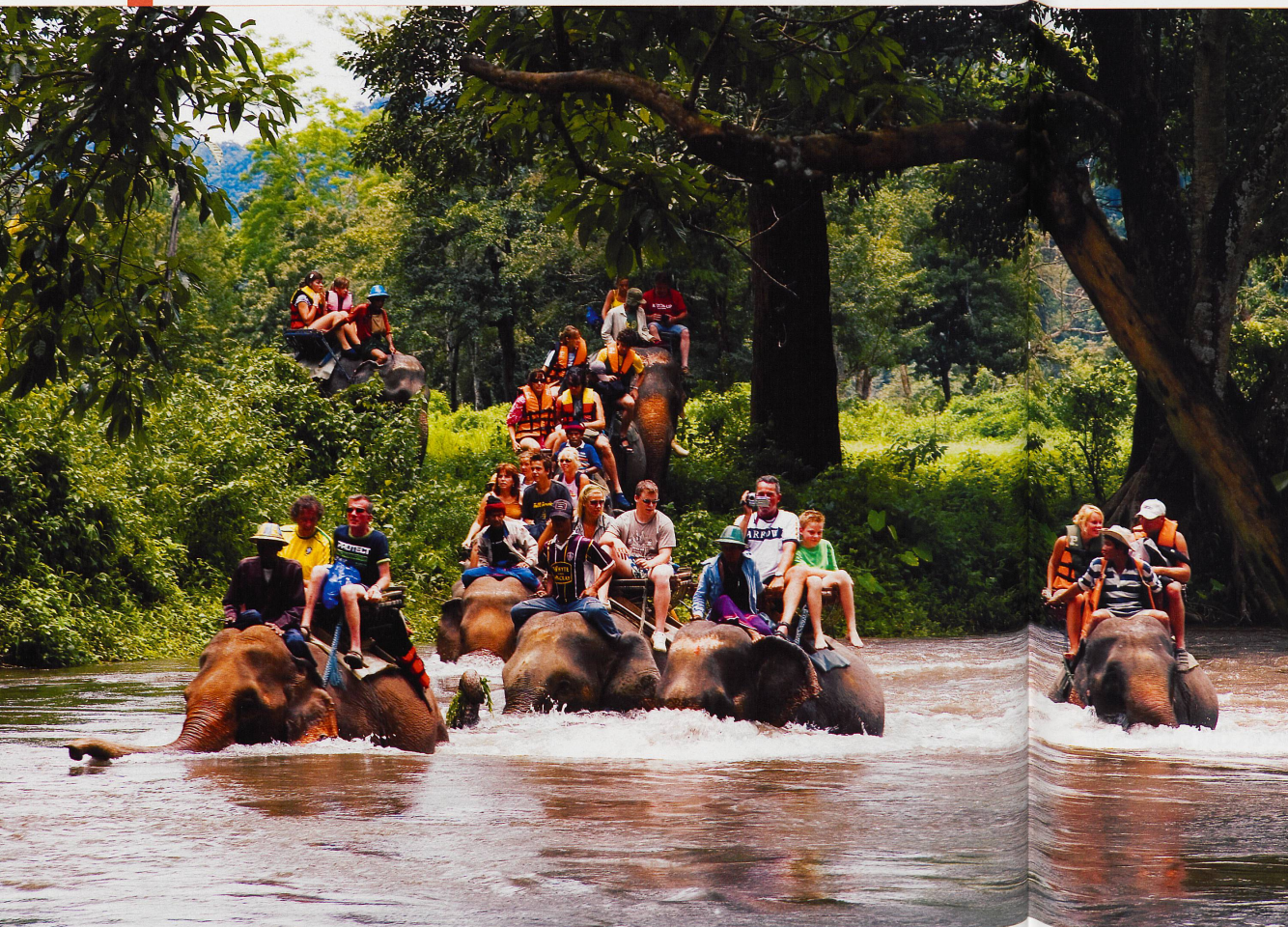
■ Les promenades à dos d'éléphant permettent d'entrer dans des forêts qui resteraient impénétrables sans leur habileté et leur intelligence.