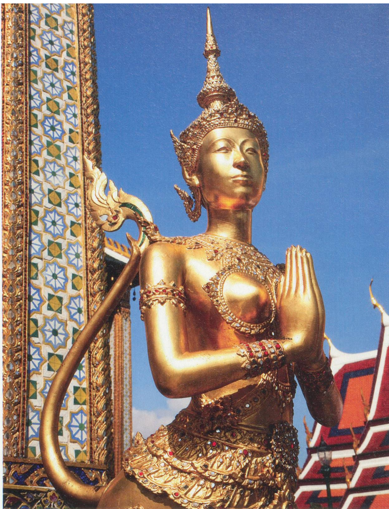
Office du tourisme de Thaïlande

Le temple du Bouddha d'Émeraude: un des plus somptueux de Bangkok.