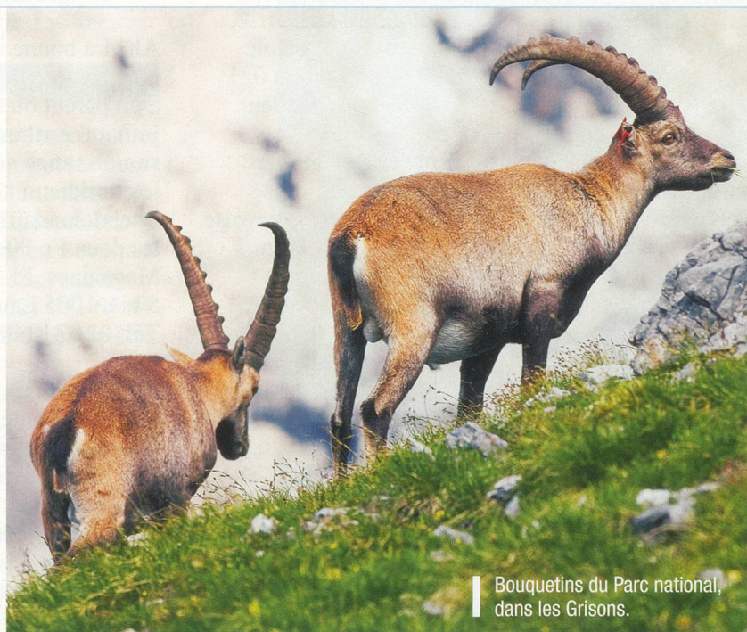
Bouquetins du Parc national, dans les Grisons.

3. Médaille. En quelle année l'écrivain suisse Carl Spitteler a-t-il reçu le prix Nobel de littérature? A. 1909; B. 1919; C. 1929.