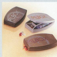
Pilbox One Day