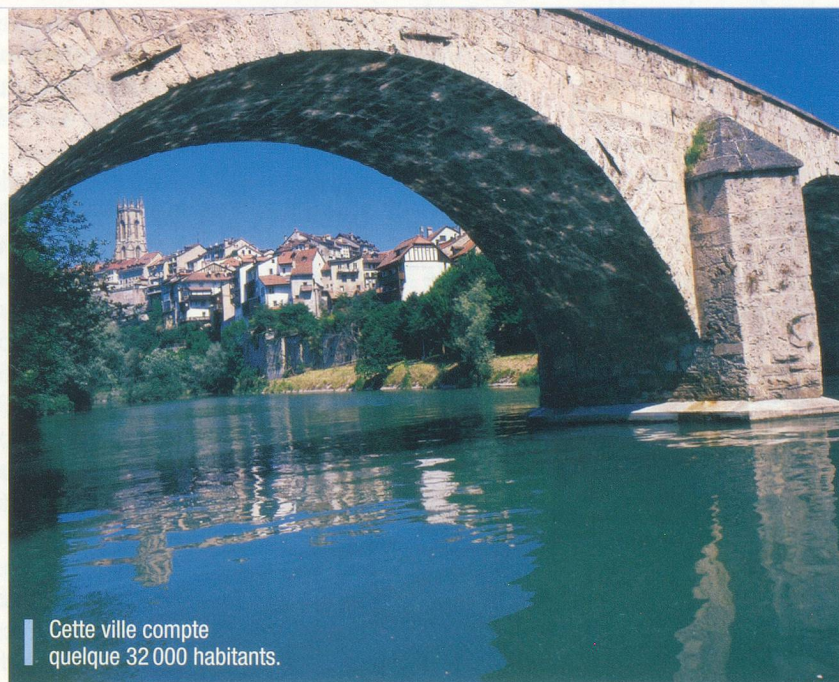
Cette ville compte quelque 32 000 habitants.

3. Population. A quelques centaines près, quelle ville de Suisse romande compte quelque 32 000 habitants? A. Vevey B. Fribourg C. Sion